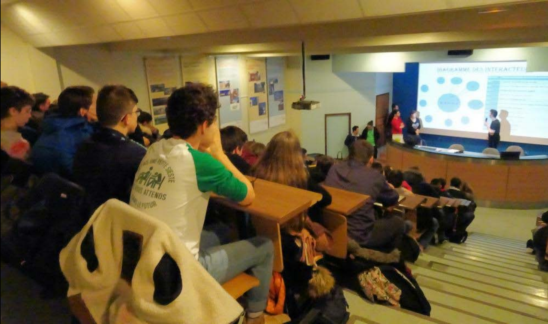
DIAGRAMME DES INTERACTELS