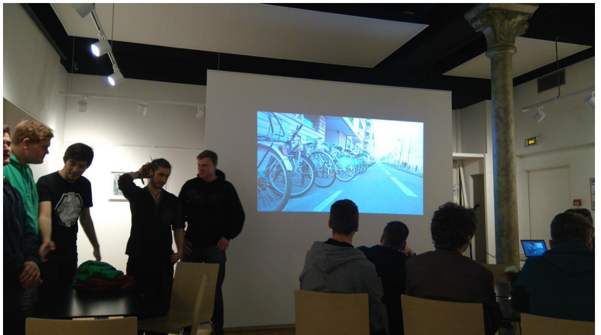
Wir haben Fotos von der Stadt gemacht und dann haben wir ein Referat gehalten. Nous avons fait des photos de la ville et ensuite on les a présenté sous forme d'exposé.