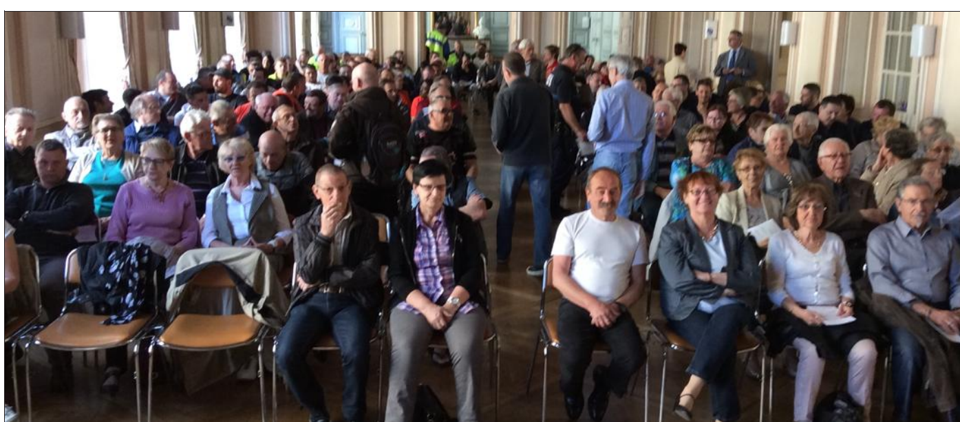
L'assistance, toujours nombreuse, a écouté attentivement les membres du comité qui ont présenté le bilan de l'année écoulée.