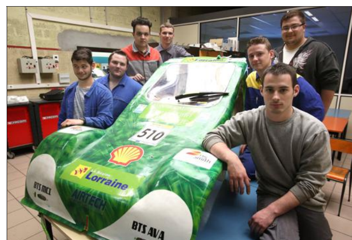
Les mécaniciens concepteurs de Talange font tout eux-mêmes, sans sous-traiter, avec un budget de 5 000 €.